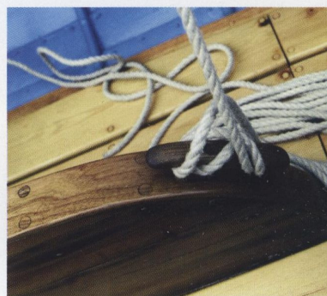
IN ALTO, PARTICOLARE DI UNA BITTA.

I gozzi con la vela latina, rivalutati negli ultimi anni dalle tradizionali regate di Stintino e da alcuni raduni, fra cui il "Trofeo Doderò" dallo Yacht Club Italiano a Boccadasse, borgo marinaro di Genova, hanno permesso di organizzare un circuito internazionale con gare in Francia e in Italia. U Càn Neigro , vincitore del "Trofeo Doderò" di quest'anno, costruito dal Cantiere Gavarrone di Varazze nel 1893, è la dimostrazione che anche le barche minori costruite per il lavoro possono essere d'epoca. Alla fine dell'Ottocento e nei primi anni del Novecento vengono organizzate in Liguria regate dette di "incoraggiamento" per gozzi e lance da