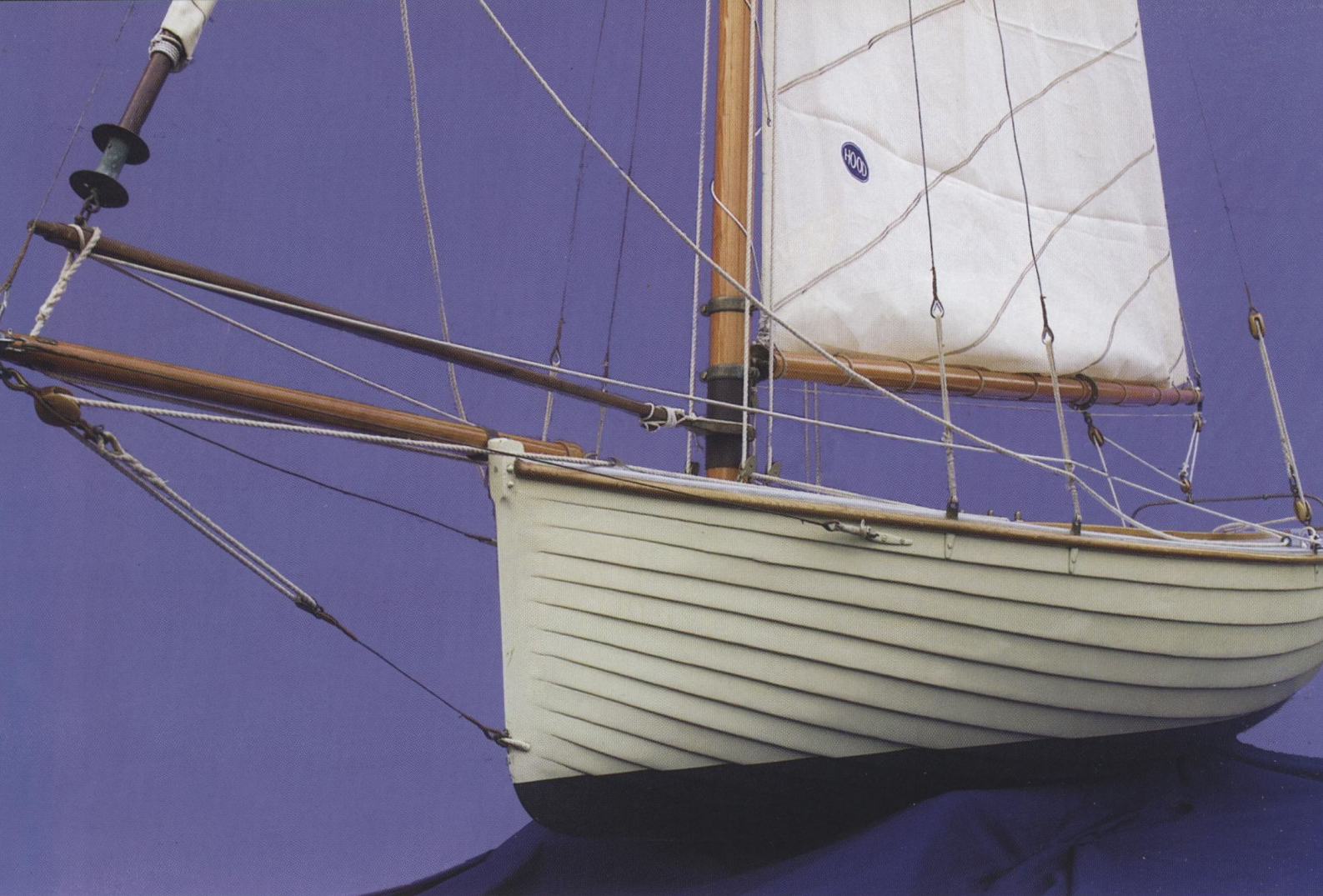
ANCORA UN'IMMAGINE DI VESPA. IL RESTAURO, IMPECCABILE DA UN PUNTO DI VISTA TECNICO, NON RISPETTAVA L'ARMO ORIGINALE. IN BASSO, IN SENSO ANTIORARIO, PARTICOLARE DELLE CAVIGLIE RACCOGLICIMA, UNA BITTA E UN BOZZELLO ORIGINALE.

le ai primi anni dello sport velico italiano e non è escluso che U Càn Neigro abbia partecipato a queste regate.